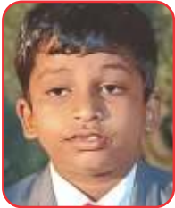
- - -